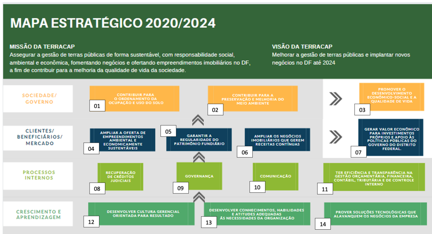
Mapa Estratégico da TERRACAP

O alinhamento estratégico das ações de TI com a organização é uma diretriz a ser seguida. Para tanto é necessário o conhecimento do mapa estratégico atual da organização e os objetivos estratégicos que devem reger o PDTI.