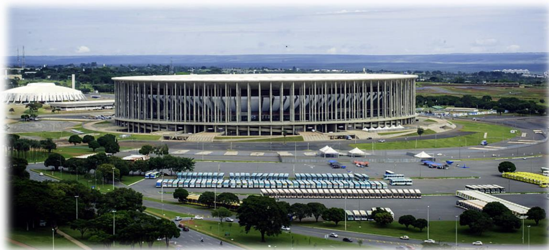
Figura 4 – Estádio Nacional de Brasília Mané Garrincha

A Secretaria de Desenvolvimento Urbano, Habitação e Meio Ambiente – SEDUMA, elaborou em setembro de 2010 o MDE 128/10, com o objetivo tão somente para estabelecer a área de implantação do novo estádio, assim como as respectivas diretrizes de uso e ocupação. No documento, são apresentados os seguintes índices para a área: