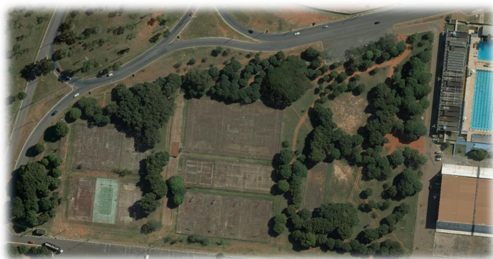
Figura 8 – Vista aérea das quadras poliesportivas

As quadras poliesportivas são compostas por: 6 quadras de futsal, 6 quadras de vôlei, 4 quadras de basquete, 3 quadras de handebol e 1 quadra de tamboréu. Essas quadras, no entanto, encontram-se abandonadas.