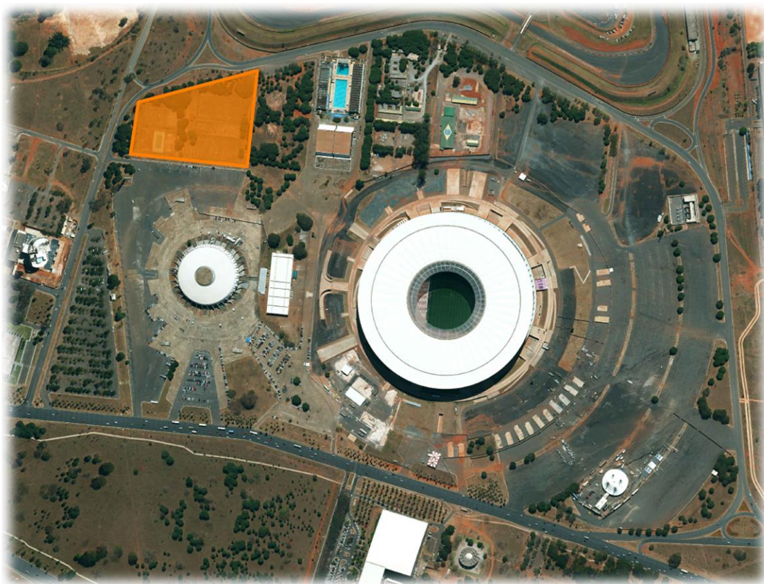
Figura 9 – vista aérea das quadras poliesportivas no complexo esportivo de Brasília