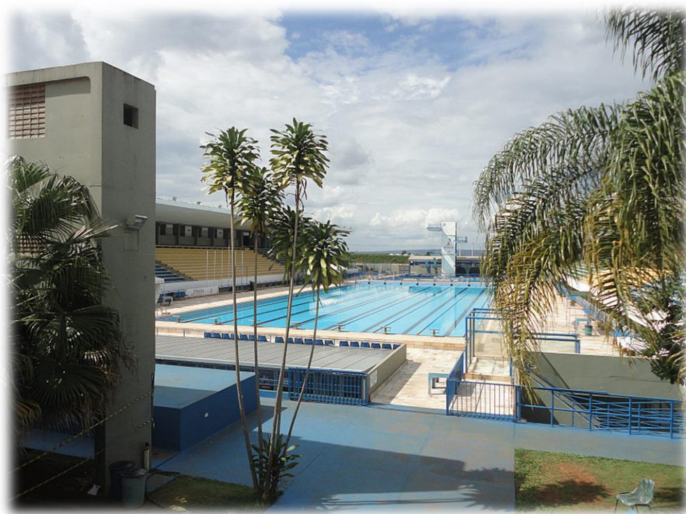
Figura 7 – Conjunto Aquático Cláudio Coutinho

Além do ginásio, existe também o Complexo Aquático Cláudio Coutinho, que conta com piscina olímpica e tanque de saltos ornamentais, com arquibancadas para 5.000 pessoas. O local encontra-se em pleno funcionamento, e lá são ministradas aulas das Escolas de Esporte da Secretaria de Esporte, tais como natação, polo aquático, salto ornamental, karatê, judô e deep water . Além disso, o complexo tem sediado campeonatos regionais e nacionais de desportos aquáticos.