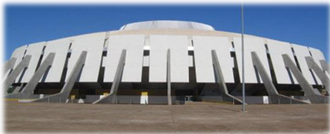
Figura 5 – Ginásio Nilson Nelson

O Ginásio Nilson Nelson (Figura 4) já foi palco de importantes atrações esportivas, musicais e religiosas, mas sua infraestrutura deficiente não atrai os produtores de eventos.