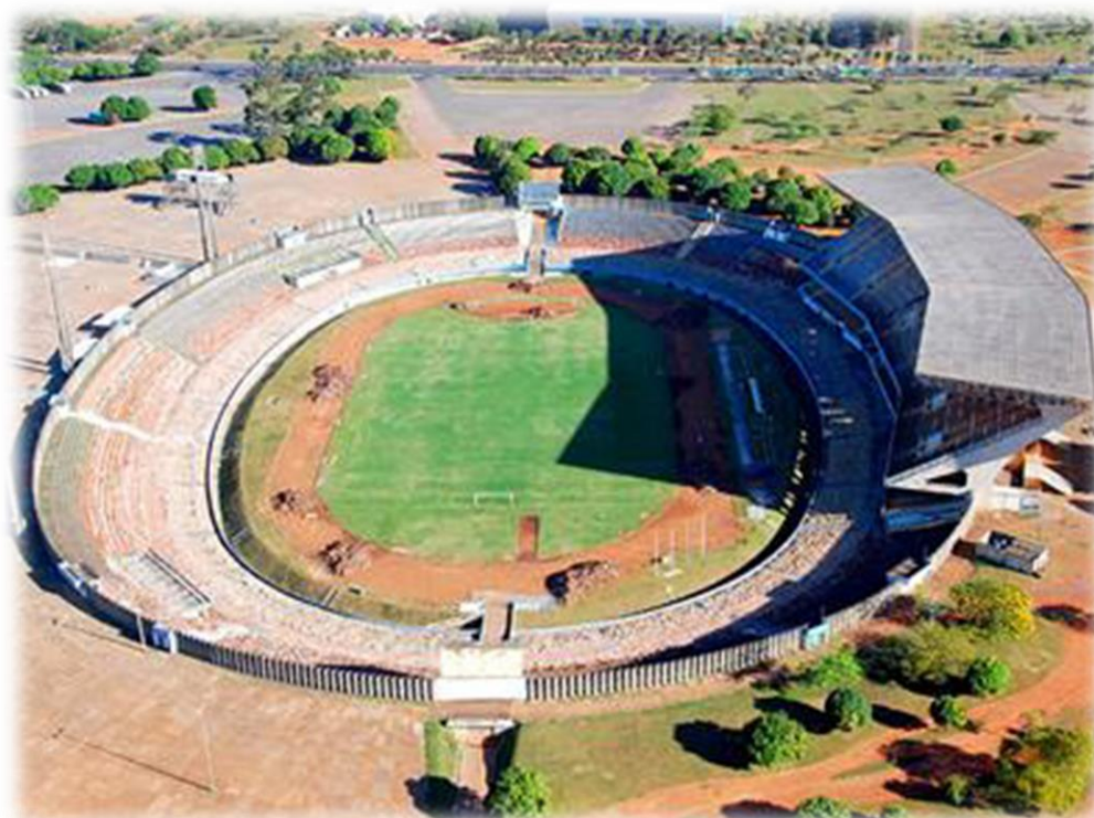
Figura 2 – Estádio Mané Garrincha antes das obras

O Estádio Mané Garrincha, tal como representado na Figura 2, foi inaugurado em 1974 e seu projeto arquitetônico original é de autoria do arquiteto Ícaro de Castro Mello, datado de 1972. O estádio não chegou a ser construído na íntegra, embora a estrutura construída dispusesse de uma capacidade de 42.200 pessoas, além de vestiários, sala de fisioterapia, alojamento, restaurante e academias.