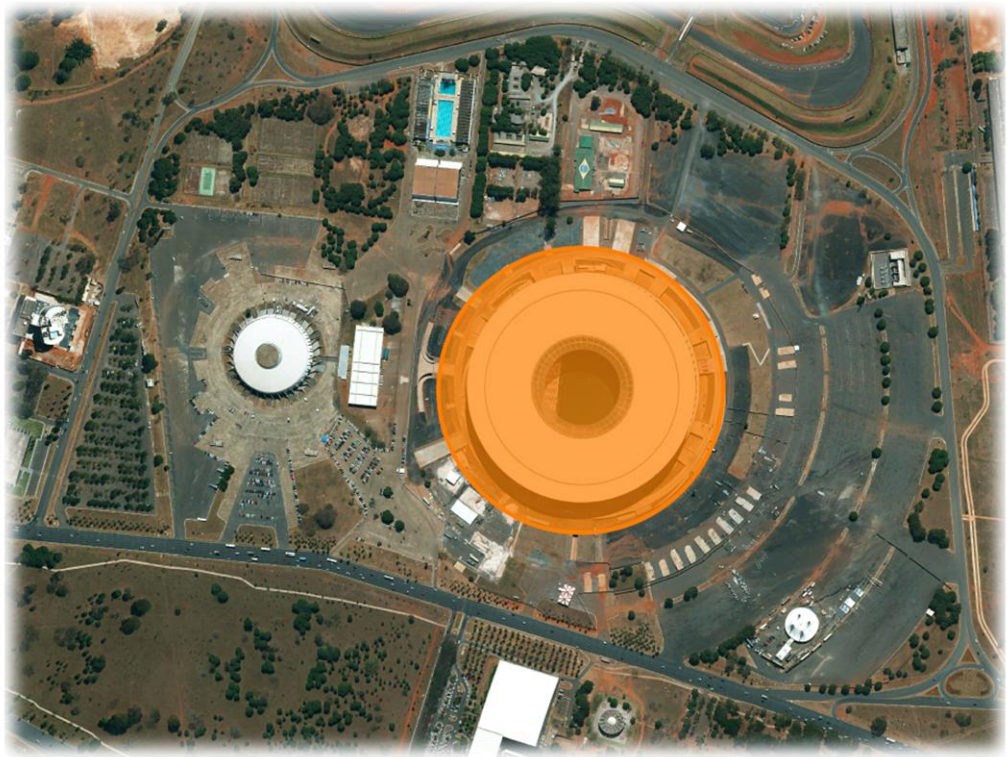
Figura 3 – Vista aérea do estádio no complexo esportivo